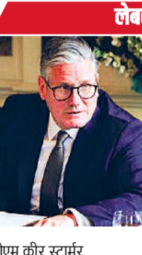
पीएम केअर स्टार्मर