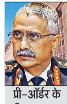
प्री-ऑर्डर के लिए उपलब्ध किताब व पब्लिश हुई किताब एक ही बात नहीं

इस बीच पूर्व सेना प्रमुख ने मंगलवार को विवाद पर विराम लगा दिया। उन्होंने सोशल मीडिया प्लेटफॉर्म एक्स पर किताब से संबंधित प्रकाशक पेंगुइन रेंडम हाउस इंडिया के आधिकारिक बयान को रीपोस्ट किया। नरवणे ने एक्स पर लिखा कि किताब की वर्तमान स्थिति यह है। जिसमें प्रकाशक ने कहा है कि किसी किताब या उसके प्री-ऑर्डर के लिए उपलब्ध होने की घोषणा को पब्लिकेशन नहीं माना जाना चाहिए। इसके साथ पब्लिकेशन हाउस ने कहा है कि प्री-ऑर्डर के लिए उपलब्ध किताब और पब्लिश हुई किताब एक ही बात नहीं है। पेंगुइन बोली- कोई भी हिस्सा पब्लिक नहीं किया : प्रकाशन कंपनी पेंगुइन रेंडम हाउस इंडिया ने कहा कि नरवणे की किताब अभी पब्लिश नहीं हुई है। पब्लिशिंग के सभी राइट्स हमारे पास हैं। अब तक किताब की न तो कोई छपी हुई और न ही डिजिटल कॉपी सामने आई है।