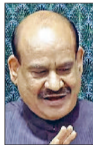
नोटिस पर 118 सांसदों के हस्ताक्षर

नई दिल्ली (एजेंसी)। विपक्ष ने मंगलवार को लोकसभा स्पीकर ओम बिरला के खिलाफ अविश्वास प्रस्ताव का नोटिस पेश कर दिया। इसमें 118 सांसदों के हस्ताक्षर हैं। ओम बिरला अब लोकसभा नहीं जाएंगे। अविश्वास प्रस्ताव के गिरने के बाद ही वह स्पीकर की चोकर संभालेंगे। एजेंसी के मुताबिक विपक्ष के अविश्वास प्रस्ताव पर सदन में 9 मार्च को चर्चा हो सकती है। 13 फरवरी को बजट सत्र के वर्तमान सेशन का आखिरी दिन है। इसके बाद 8 मार्च से सदन की कार्यवाही फिर से शुरू होगी। इससे पहले बजट सत्र के 10वें दिन संसद दो बार स्थगित हुई।