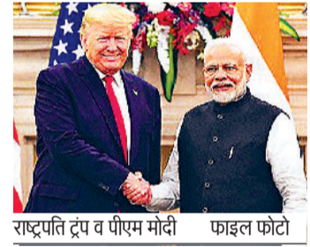
राष्ट्रपति ट्रंप व पीएम मोदी फाइल फोटो

रूसी तेल की शिपमेंट में कमी आई हालिया आंकड़ों में गिरावट साफ दिखाई दे रही है। कीव स्कूल ऑफ इकोनॉमिक्स और यूएस एनर्जी इंफॉर्मेशन एडमिनिस्ट्रेशन के आंकड़ों के मुताबिक, भारत में रूसी तेल की शिपमेंट में पिछले कुछ हफ्तों में कमी आई है। यह आंकड़ा अक्टूबर में 2 मिलियन बैरल प्रतिदिन से घटकर दिसंबर में 1.3 मिलियन बैरल प्रतिदिन रह गया है। यह गिरावट दर्शाती है कि अमेरिकी दबाव और प्रतिबंधों का असर व्यापारिक निर्णयों पर पड़ रहा है।