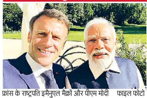
फ्रांस के राष्ट्रपति इमैनुएल मैक्रों और पीएम मोदी फाइल फोटो

मैक्रों की यात्रा ऐसे वक्त में हो रही है जब भारत में वायुसेना के लिए 114 और राफेल विमानों की खरीद पर सहमति बनती हुई दिख रही है। इसलिए यह भी संभावना जताई जा रही है कि मोदी और मैक्रों के बीच इस मुद्दे पर भी शुरुआती बातचीत हो सकती है। राफेल बगाने वाली कंपनी भारत में राफेल विमानों के निर्माण के लिए सैद्धांतिक रूप से सहमत बताई जाती है। भारत का रक्षा मंत्रालय इस सप्ताह फ्रांस से 114 राफेल लड़कू विमान खरीदने की एक बड़ी डील को मंजूरी दे सकता है। यह सोदा भारतीय वायुसेना के लिए किया जा रहा है, जिसकी कुल कीमत लगभग 3.25 लाख करोड़ रुपये बताई जा रही है। इस सोदे को पीएम नरेंद्र मोदी की अध्यक्षता वाली कैबिनेट कमेटी ऑन सिक्योरिटी से भी मंजूरी लेनी होगी।