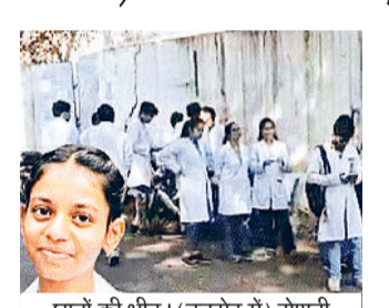
छात्रों की भीड़ (इनसेट में) रोशनी