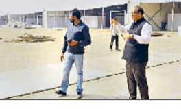
है कि ढाई लाख के आस-पास किसान व आमजन मेलें पहुंचेंगे। इस बार लगभग 290 कम्पनियां इत्र मेलें में भाग ले रही हैं। नए-नए ट्रैक्टरों का उद्घाटन कृषि मेलें में होगा। किसान ड्रेम में आए नए बदलावों के बारे में रूबरू होंगे।