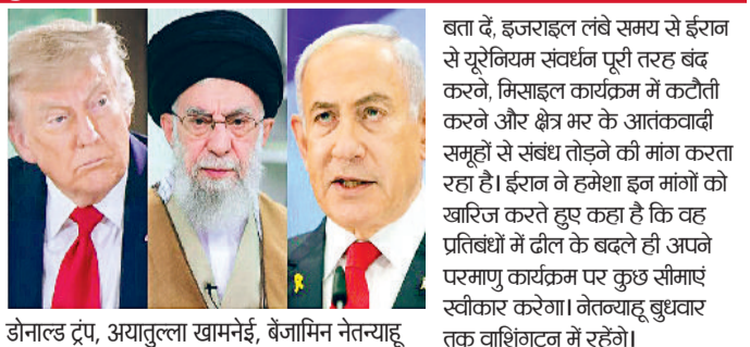
डोनाल्ड ट्रंप, अयातुल्ला खामनेई, बेंजामिन नेतन्याहू

नेतन्याहू, राष्ट्रपति ट्रंप से करेंगे मुलाकात 'विंग ऑफ जायन्त' विमान से हुए रवाना